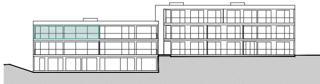
Bâtiment C - Façade Ouest