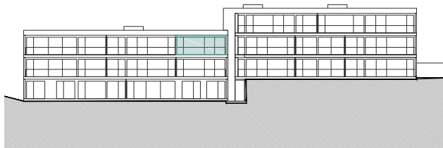
Bâtiment A - Façade Ouest