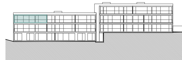
Bâtiment A - Façade Ouest